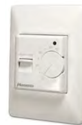
MTH M120 MTH M240