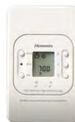
MTH AFP MTH FLM